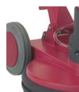
Moteur décentré permettant un meilleur équilibre