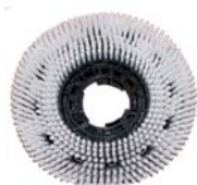
CA 742059 Brosse de lavage