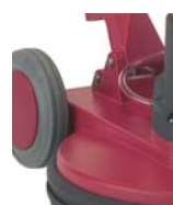
Moteur décentré permettant un meilleur équilibre